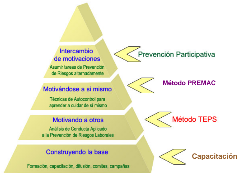
Fig. 1. Programas de intervención para la Seguridad del Trabajo, de PERSIST LTDA., basados en la Psicología de la Conducta.

La figura siguiente (Fig. 1) muestra los diferentes Métodos conductuales desarrollados por PERSIST LTDA, para aumentar la seguridad del trabajo en la empresa: